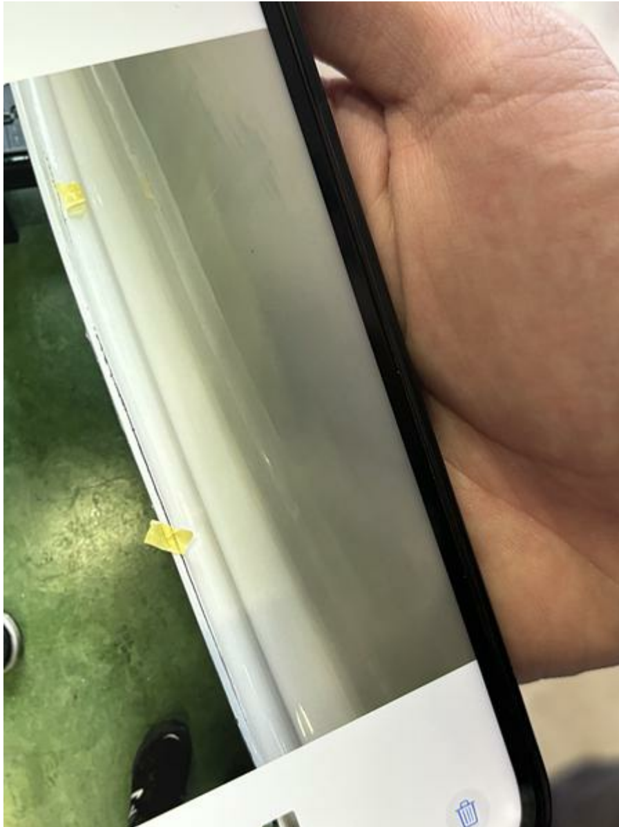
IMG_2154.jpeg 2.78 MB