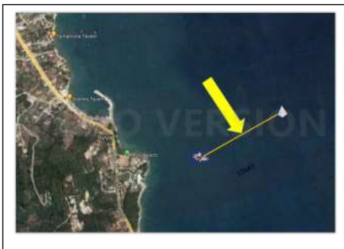
ΕΝΔΕΙΚΤΙΚΗ ΓΡΑΜΜΗ ΕΚΚΙΝΗΣΗΣ ΑΠΟ ΛΥΓΕΙΑ