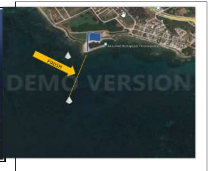
ΕΝΔΕΙΚΤΙΚΗ ΓΡΑΜΜΗ ΤΕΡΜΑΤΙΣΜΟΥ ΣΕ ΠΡΕΒΕΖΑ