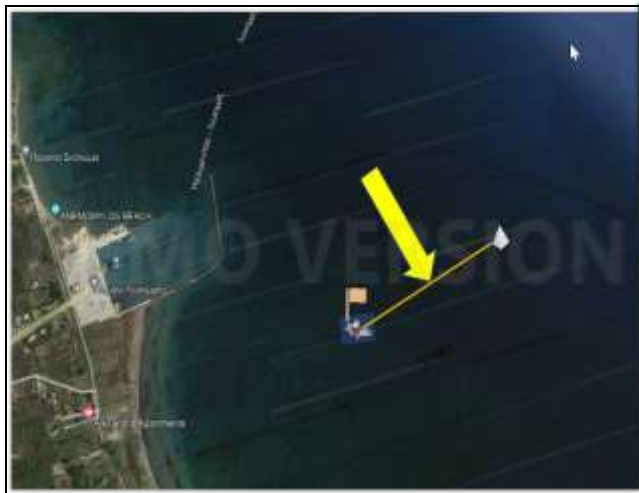
ΕΝΔΕΙΚΤΙΚΗ ΓΡΑΜΜΗ ΕΚΚΙΝΗΣΗΣ ΑΠΟ ΛΕΥΚΙΜΗ