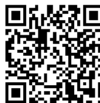
Invia richiesta di inserimento in classifica

AVVISO: Quando si invia una protesta, una richiesta o un rapporto, la procedura rimane invariata (come da Regole di Regata e Istruzioni di Regata).