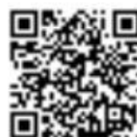
Calendario delle udienze