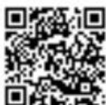
Verbali delle udienze