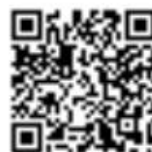
Invia richiesta di inserimento in classifica

AVVISO: Quando si invia una protesta, una richiesta o un rapporto, la procedura rimane invariata (come da Regole di Regata e Istruzioni di Regata).