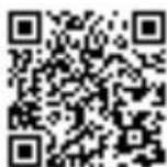
Modulo di protesta

Avviso: L'Albo Ufficiale dei Comunicati (AUC) rappresenta la sola fonte ufficiale di informazioni per questa regata.