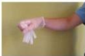
Recoger el primer guante con la otra mano