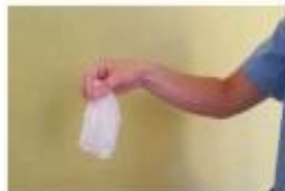
Retirar los dos guantes en el contenedor adecuado