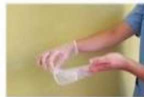
Retirar el guante en su totalidad