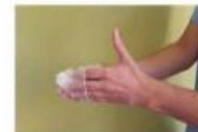
Retirar el guante sin tocar la parte externa del mismo