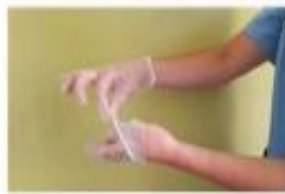
Retirar sin tocar la parte interior del guante