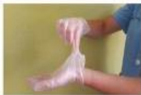
Pellizcar por el exterior del primer guante