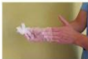
Retirar el segundo guante introduciendo los dedos por el interior