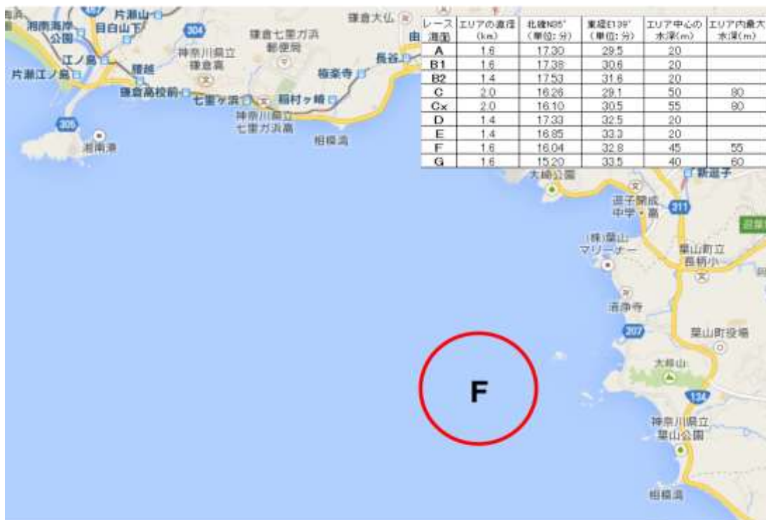
【添付図 B】 レース・エリア