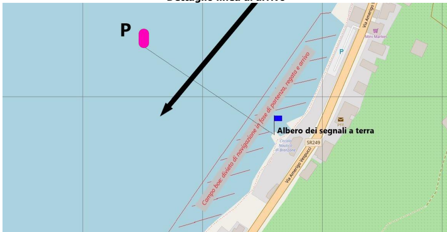
Immagine 5 Dettaglio linea di arrivo

Linea di arrivo data dall'allineamento fra bandiera blu su albero dei segnali a terra, da tenere a sinistra, e boa di colore FUCSIA P , da tenere a destra.