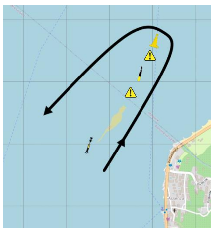
Immagine 4 Dettaglio passaggio Isola del Trimelone

Divieto di navigazione in fase di partenza, regata e arrivo nel campo boe del Circolo Nautico Brenzone.