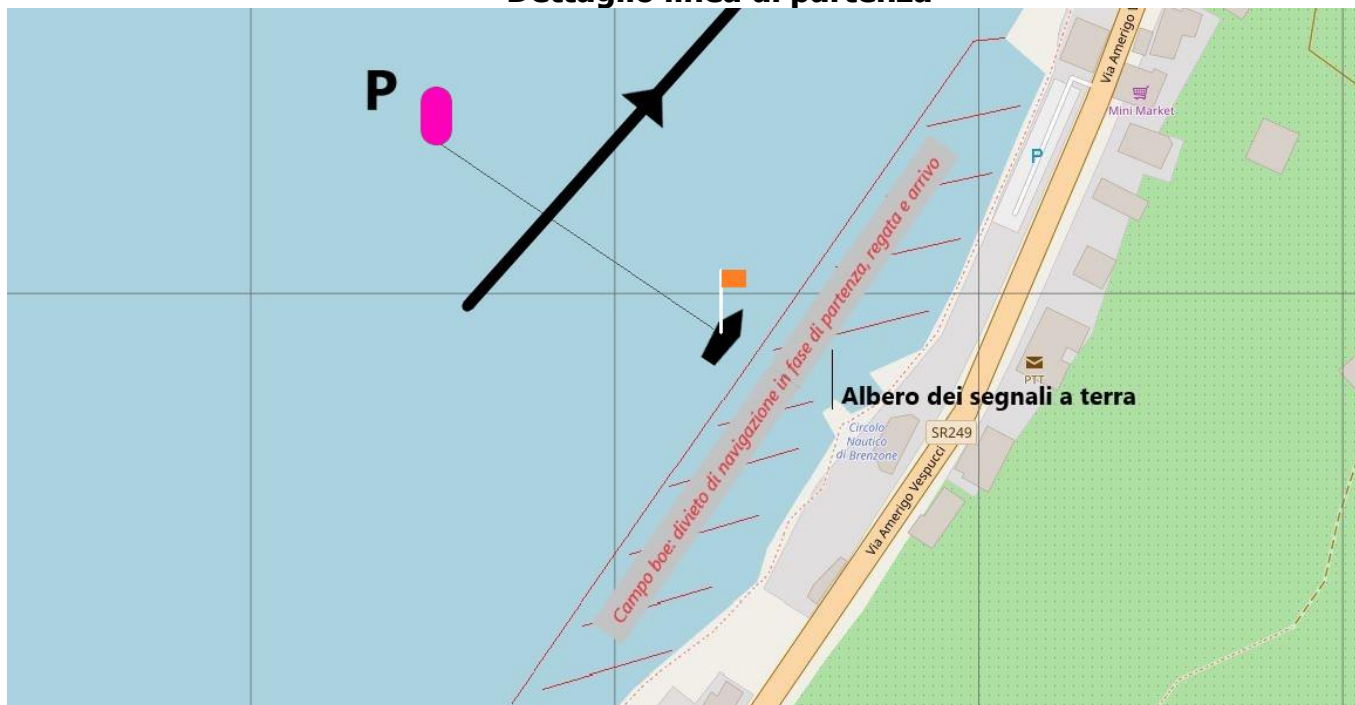
Immagine 1 Dettaglio linea di partenza

Linea di partenza data dall'allineamento fra bandiera arancione su barca Comitato di Regata, da tenere a destra, e boa di colore FUCSIA (P), da tenere a sinistra.