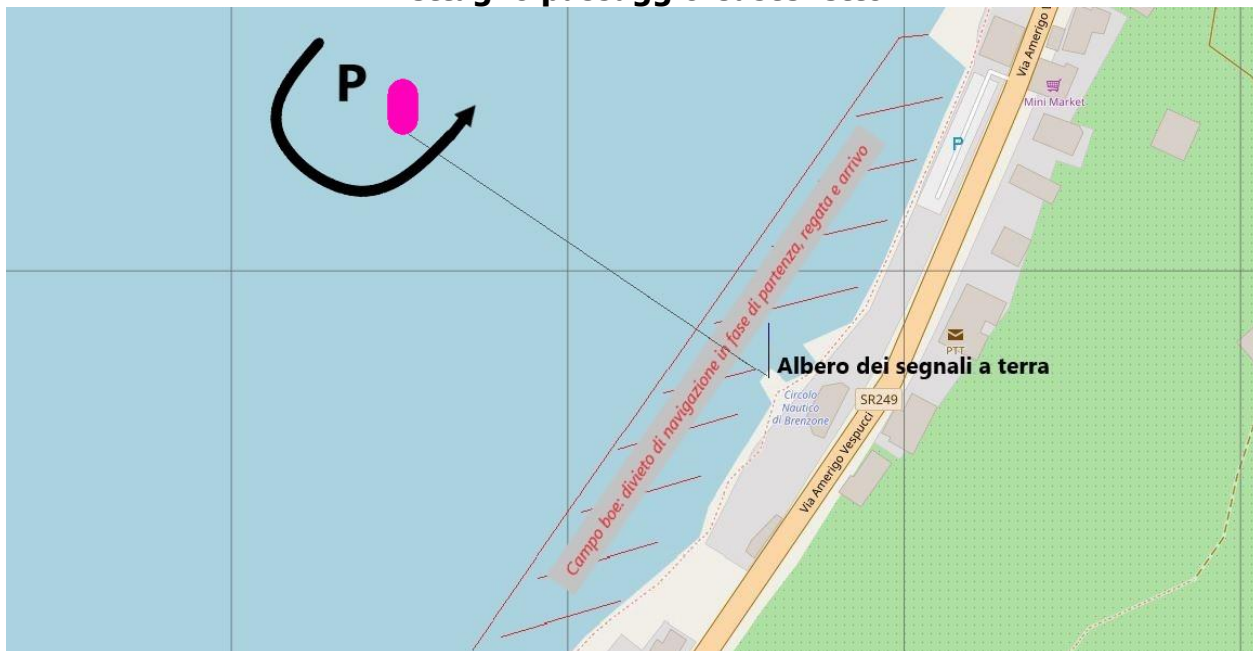
Immagine 3 Dettaglio passaggio Castelletto

Boa di colore FUCSIA P da tenere a sinistra.