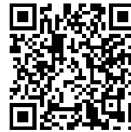
Invia richiesta di inserimento in classifica

AVVISO: Quando si invia una protesta, una richiesta o un rapporto, la procedura rimane invariata (come da Regole di Regata e Istruzioni di Regata).